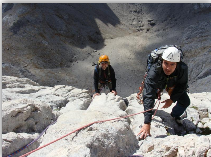
Llegando al nicho (4ª reunión)