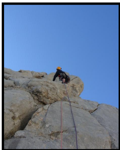
Atacando la placa del 2º largo