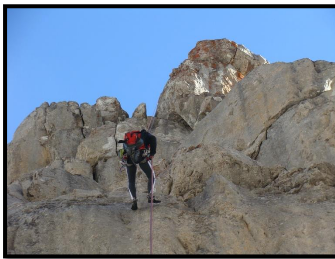
Rapel a la horquilla norte