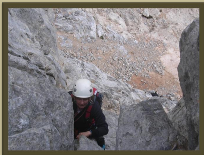
Llegando a la primera reunión